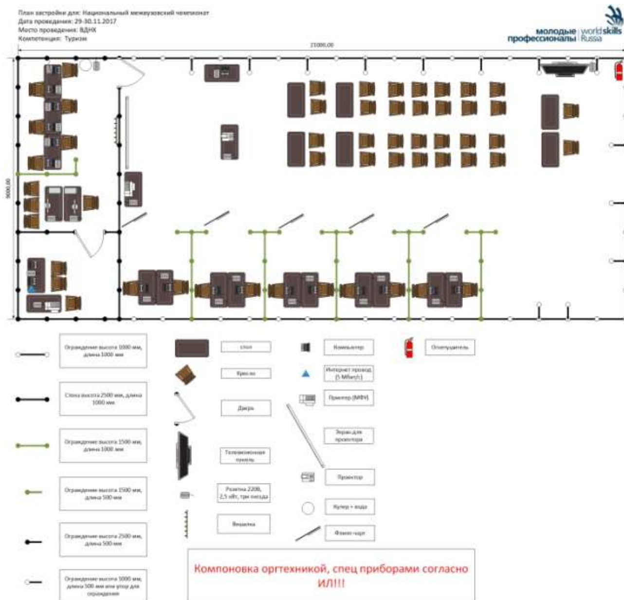
Схема конкурсной площадки