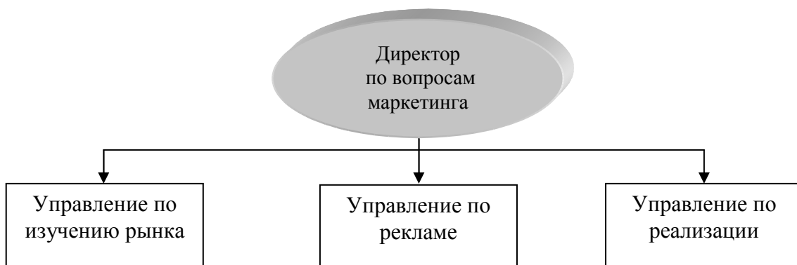
Рисунок 2.3. Организационная схема управления маркетингом

Организационная схема управления маркетингом представлена на рисунке 2.3.